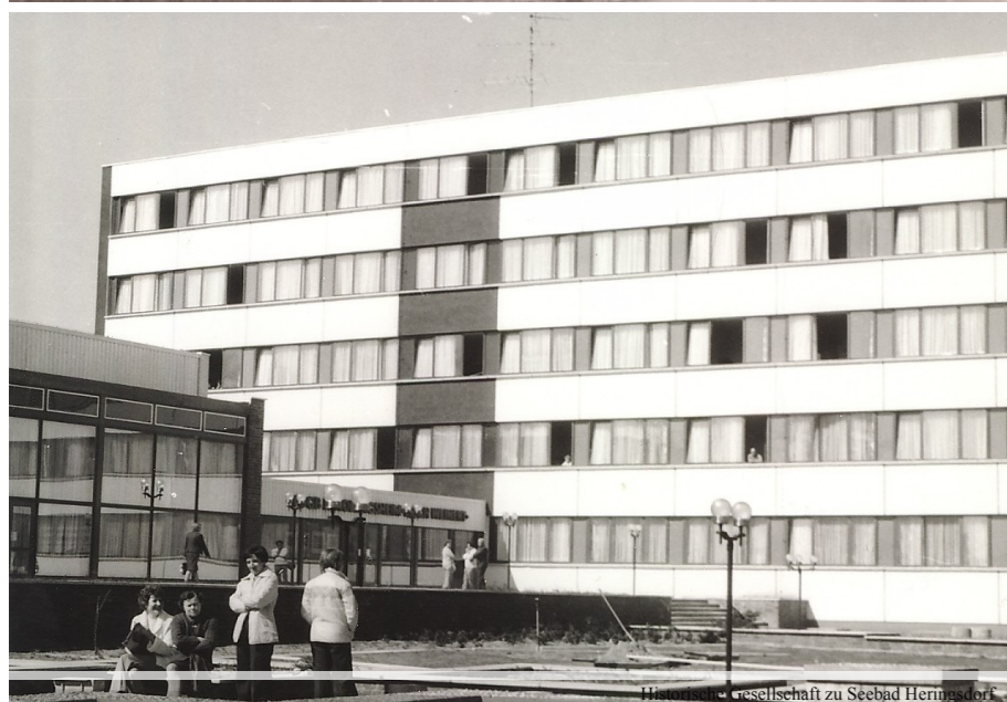
Historische Gesellschaft zu Seebad Heringsdorf