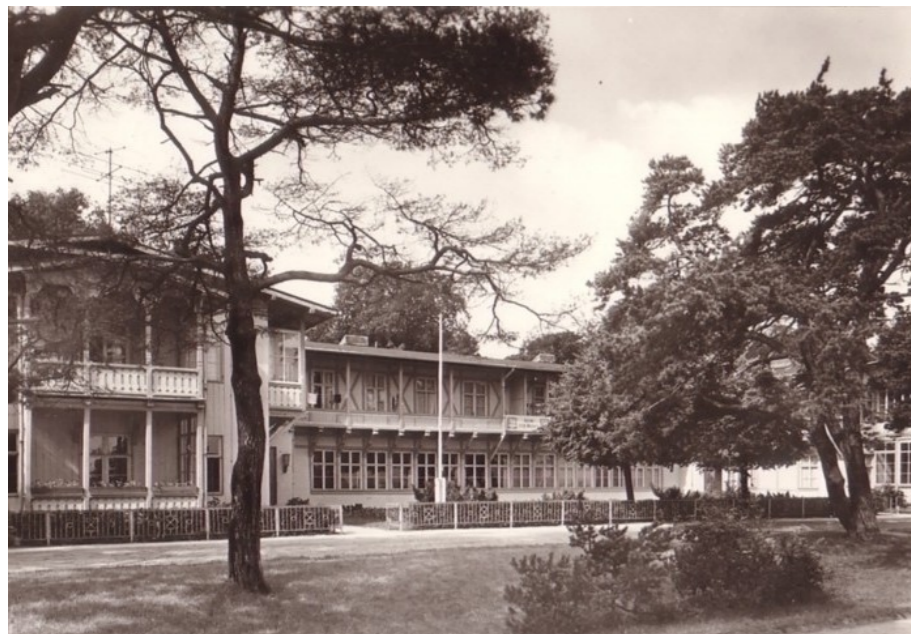
Historische Gesellschaft zu Seebad Heringsdorf